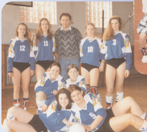
V plné “polní”

Po tři roky trvání tohoto družstva se děvčata účastnila krajského přeboru dorostenek a posléze také okresního přeboru žen.