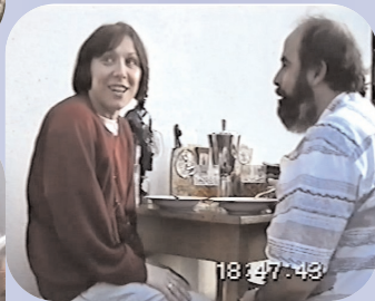
a prohlížením trofejí