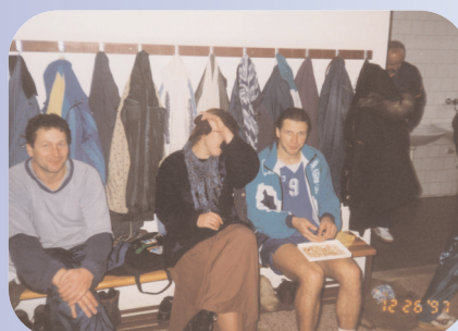
Občerstvení - co dům dal