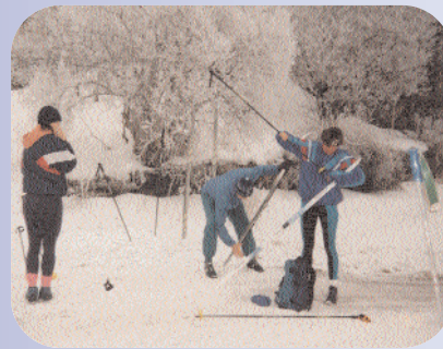
A bylo potřeba i občas přemazat lyže, nejen sebe