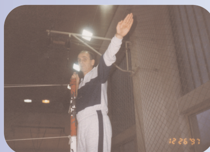
A kdo nejedl, nepil a nehrál - tak si pískal