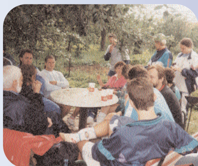
Společná snídaně u jednoho stolu

Družstva z Oder a okolí ale tyto změny nikterak neovlivnily a pravidelně se do hlavních soutěží dostávaly. Nejinak tomu bylo i v tomto ročníku.