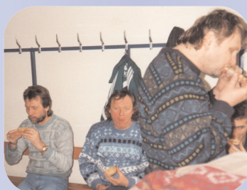
Svačina na šatně