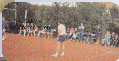
VC Odry v náhradním složení