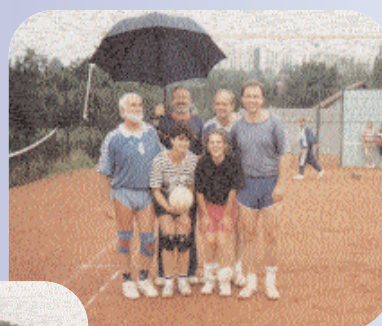
VC Odry v náhradním složení