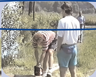
Začalo to prací