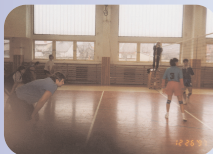
Předvedený výkon - co každý vydržel