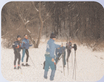
Nucená zastávka zvaná “občerstvovací”

Nejen volejbalem žili členové oderského oddílu. K udržování své fyzické kondice a hlavně k utužování kolektivu byly pořádány časté výlety do okolní zimní krajiny. Velice oblíbeným úsekem se stala trasa Svatoňovice - Spálovský mlýn. Není roku, aby se alespoň pár jedinců nepokusilo s větším či menším úspěchem zdolat tento běžecký úsek s mnoha brody. Důležité bylo vždy, dle sněhových podmínek, namazat lyže a pak postupně trasou posílit “vnitřím mazáním” i sebe.